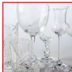
Oggetti di cristallo (bicchieri, lampadari, centrotavola, etc.)