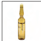
Confezioni in vetro dei farmaci usati