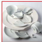
Stoviglie in ceramica e porcellana