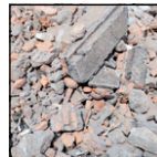
Pietre, vasi di coccio e materiali edili

Questi “falsi amici” vanno gettati con i rifiuti indifferenziati. Per grandi quantità e per i RAEE è indicata la consegna alla piattaforma ecologica del Comune. Eventuali sacchetti, usati per il trasporto, vanno conferiti nella raccolta differenziata del materiale di cui sono composti.