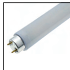
Tubi al neon