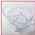
Contenitori in borosilicato