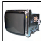
Tubi e schermi tv, computer, monitor